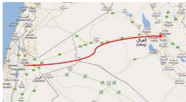
Reiseroute von Amman nach Bagdad im Jahr 2003

Als im März 2003 die Amerikaner mit ihren Verbündeten in den Irak einmarschierten und Saddam Hussein gestürzt wurde, erhielten irakische Staatsangehörige in der Regel eine vorläufige Aufnahme in der Schweiz. Trotzdem meldeten sich in der ersten Hälfte des Jahres 2003 rund 60 irakische Staatsangehörige für eine freiwillige Rückkehr in den Irak an. Daraufhin beschloss das BFM, ein Rückkehrhilfeprogramm zu lancieren. Anfangs erhielten die Teilnehmerinnen und Teilnehmer 2'000 USD am Flughafen in der Schweiz ausbezahlt, weil es zu diesem Zeitpunkt im Irak noch keine Strukturen gab, welche eine kontrollierte Auszahlung von Zusatzhilfeeinstellungen ermöglicht hätten.