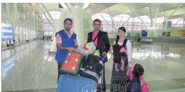
Ankunft einer Familie in Erbil

Mitarbeiter von IOM Erbil unterstützen freiwillige Rückkehrerinnen und Rückkehrer bei ihrer Ankunft im Irak. Die Unterstützung umfasst das Abholen am Flughafen, die Auszahlung der Starthilfe, und, falls gewünscht, die Organisation des Weitertransport bis zum Zielort. Ausserdem notiert IOM Erbil das Reiseziel und die Kontaktdaten der Programmteilnehmenden und teilt ihnen die Adressen der Lokalbüros von IOM im Irak mit. Danach informiert IOM Erbil die IOM-Vertretung im jeweiligen europäischen Land über die Ankunft der zurückgekehrten Personen, damit diese die Partner informieren können.