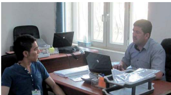
Beratungsgespräch bei IOM Erbil

Die Rückkehrerinnen und Rückkehrer besuchen das IOM-Büro für Beratungsgespräche und um detaillierte Informationen über alle Optionen der Reintegrationsprogramme zu erhalten. Je nach Aktivität, die die Personen für ihre Reintegration wählen, müssen bestimmte Dokumente eingereicht werden. Normalerweise braucht es mehr als ein Beratungsgespräch, um alles Notwendige für die Reintegrationshilfe fertig zu stellen.