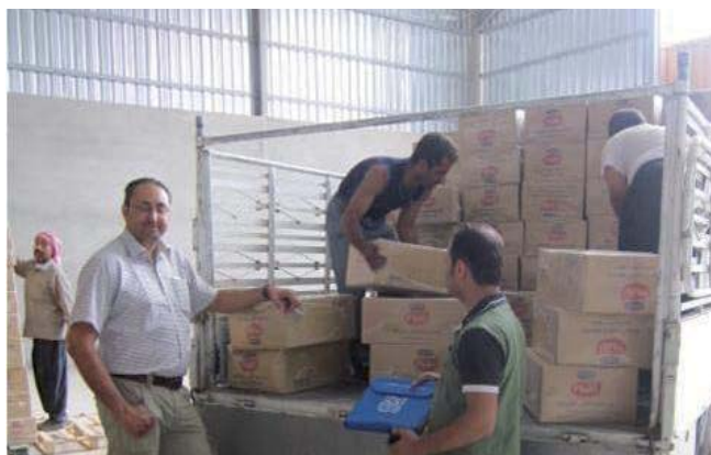
Kauf von Gütern direkt beim Lieferanten

Sobald IOM Erbil die Bestätigung des Büros im Land, aus dem die Person zurückkehrt war, erhalten hat und auch die Logistikabteilung von IOM Irak konsultiert wurde, vereinbaren die IOM-Mitarbeitenden einen Termin bei dem Zulieferer oder Händler, um zusammen mit den Rückkehrerinnen und Rückkehrern das gewünschte Material zu kaufen. Wenn es um Stellenvermittlung geht, arrangiert IOM Erbil die Auszahlung des monatlichen Lohnes.