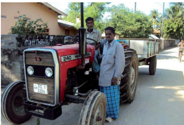
Ein Rückkehrer aus der Schweiz hat ein Landwirtschaftsprojekt begonnen und einen Traktor gekauft.

Gemäss IOM Colombo haben Rückkehrerinnen und Rückkehrer aus der Schweiz tendenziell ihr Reintegrationsprojekt vor der Reise besser vorbereitet und sind älter als Rückkehrende aus anderen europäischen Ländern. Aufgrund des hohen Alters haben sie daher öfter medizinische Beschwerden.