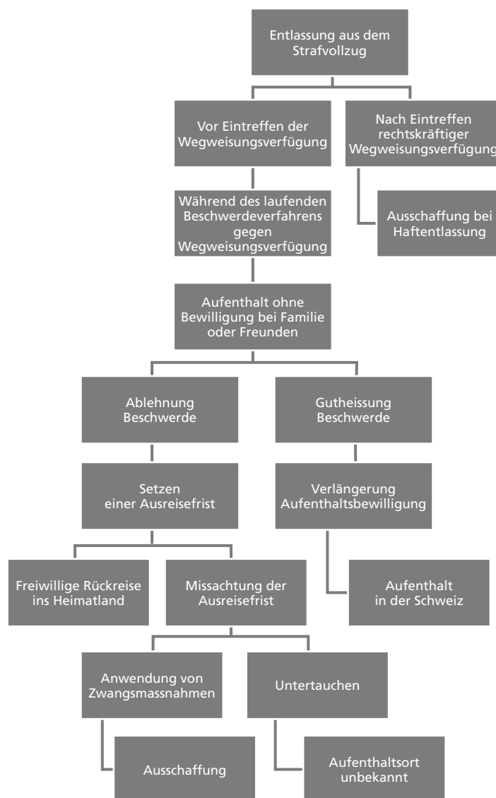
Abbildung 3: Vollstreckung der Wegweisung (Ausschaffung)

In der Diskussion über Wegweisungen wird oft argumentiert, dass die Vollstreckung der Entscheidungen die grössten Probleme bereite. Die im Rahmen dieser Studie interviewten Expertinnen bzw. Experten und Migrationsbehörden waren sich einig, dass die Vollstreckung der Wegweisungen von straffälligen Personen keine grossen Probleme bereitet, da der Grossteil der straffällig gewordenen Ausländerinnen und Ausländer bei Haftentlassung ausgeschafft werden kann. Des Weiteren verfügen die meisten Niedergelassenen und Aufenthalter bzw. Aufenthalterinnen über Identitätspapiere, die die Beschaffung der benötigten Reisedokumente ermöglichen. Insgesamt stützt die Mehrheit der Expertinnen und Experten die Auffassung, dass der Vollzug der Wegweisungen der Personen mit einer ausländerrechtlichen Bewilligung keine grossen Probleme bereite, während im Asylbereich die grössten Herausforderungen in diesem Bereich liegen (siehe auch Parlamentarische Verwaltungskontrolle 2005).